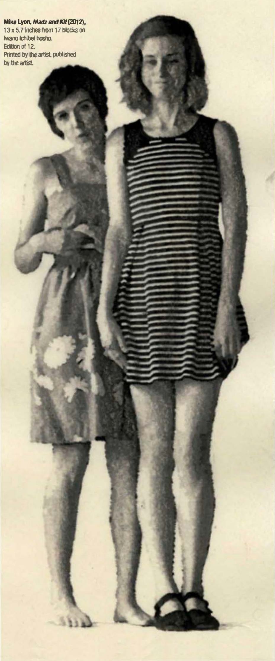
Mike Lyon, Madz and Kiri (2012), 13 x 5.7 inches from 17 blocks on Iwano Ichibei Hoshio. Edition of 12. Printed by the artist, published by the artist.